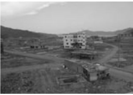
④壊滅的な大槌町の様子

「全国の教会が被災沿岸部を支援するプロジェクト」(カトリック中央協議会東日本大震災復興支援室主催)と題して、全国担当者会議及び視察が七月十一日(月)と十二日(火)の日程で仙台教区カテドラルを中心に開催された。