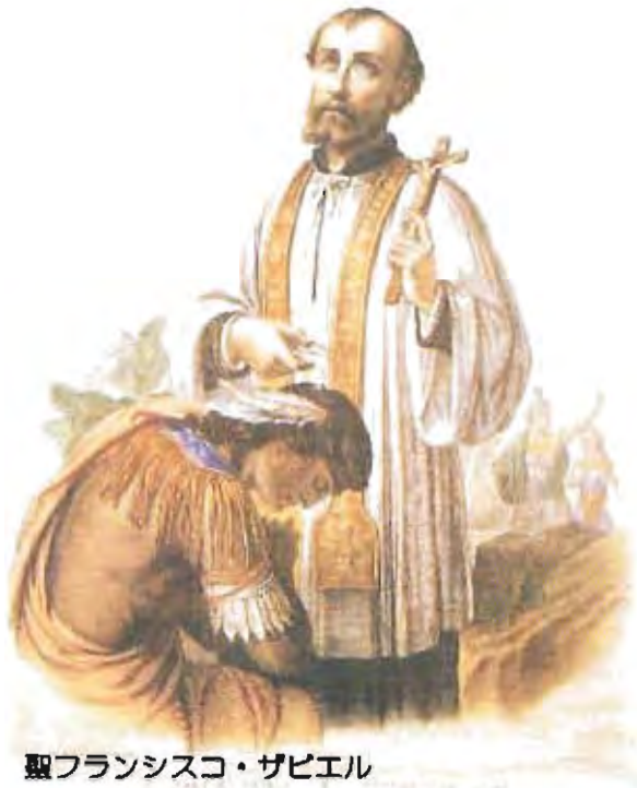
聖フランシスコ・ザビエル

旅行代金: 350,000円 (福岡空港発着・添乗員同行・全食事付) ※燃油サーチャージ、空港税、査証料及び代行手数料等、合計55,906円含みます。