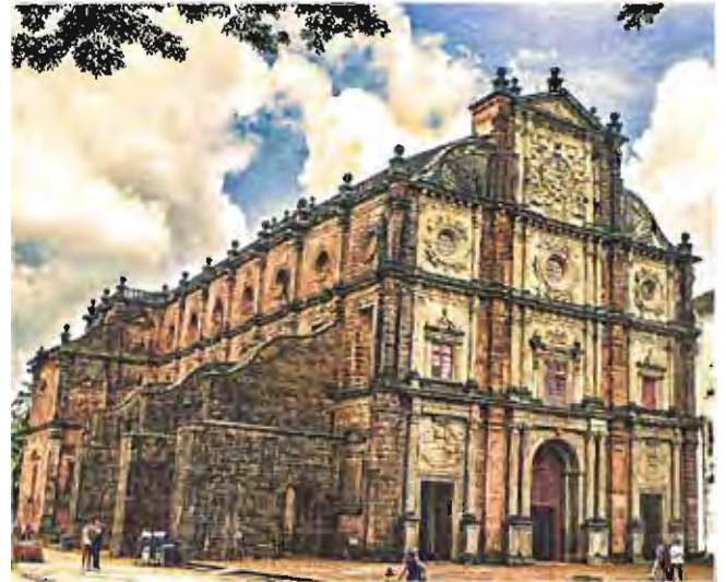
聖フランシスコ・ザビエルの聖遺物が安置されるボン・ジエス教会 (ゴア) "Basilica of Bom Jesus, old goa" by P.S.SUJAY