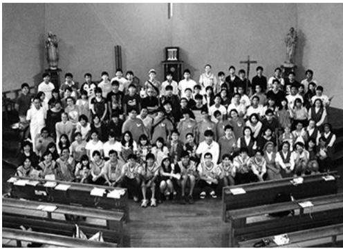
ザビエル教会で記念撮影

鹿児島での開催は8年ぶり2回目。テーマを「ゆ(ゆ)くいきやんせ」467(よくろんな)と題