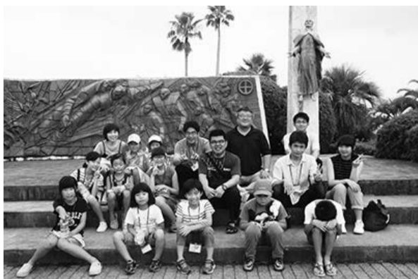
ザビエル上陸記念碑前で記念撮影

第5回「夏休み子ども大会」(聖書学校)が8月2日から4日まで、唐湊の司教館であった。今年のテーマは「みんな神さまの子ども」。参加した子どもたちは、市内教会訪問や寸劇など、2泊3日のメニューを通して「神さまの子ども」としての在り方や心がけを楽しく学んだ。