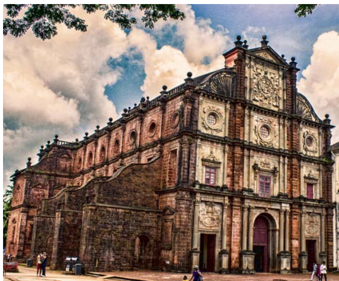
聖フランシスコ・ザビエルの聖遺物が安置されるボン・ジェス教会(ゴア) "Basilica of Bom Jesus, old goa" by P.S.SUJAY