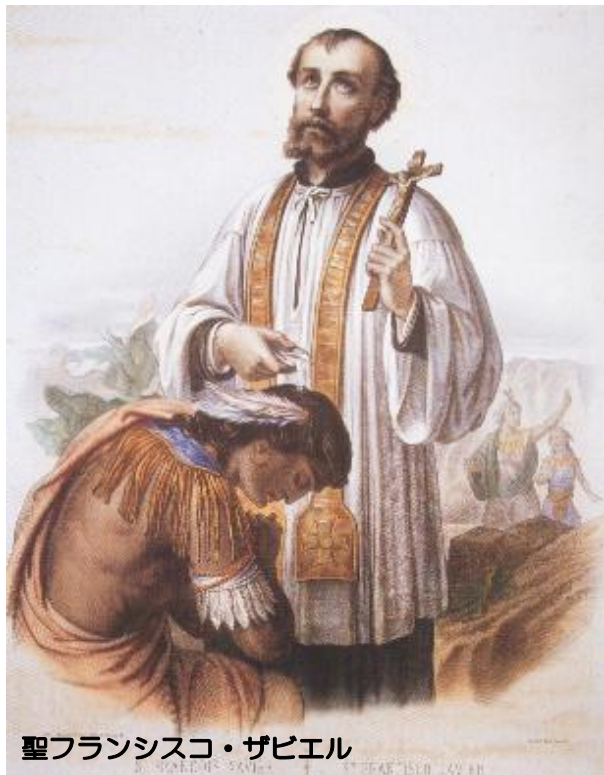
聖フランシスコ・ザビエル

旅行代金: 346,000円 (福岡空港発着・添乗員同行・全食事付) ※燃油サーチャージ、空港税、査証料及び代行手数料等、合計約61,000円が別途必要です。詳細は下記に記載。